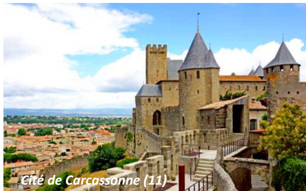
Cité de Carcassonne (11)