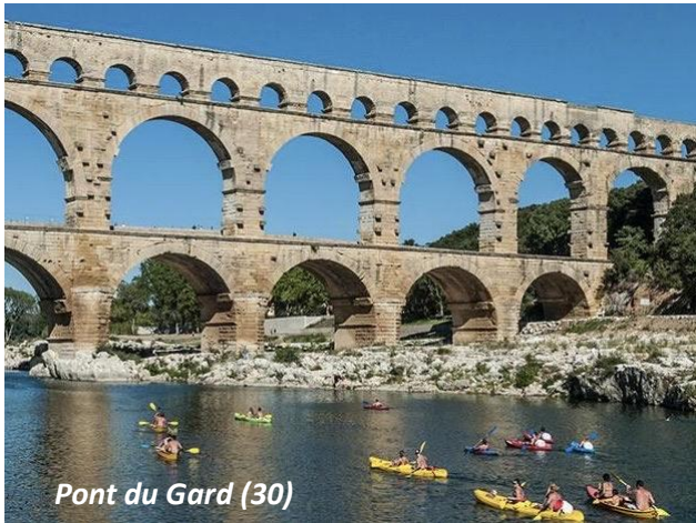
Pont du Gard (30)