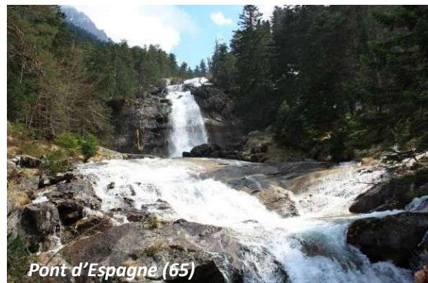
Pont d'Espagne (65)