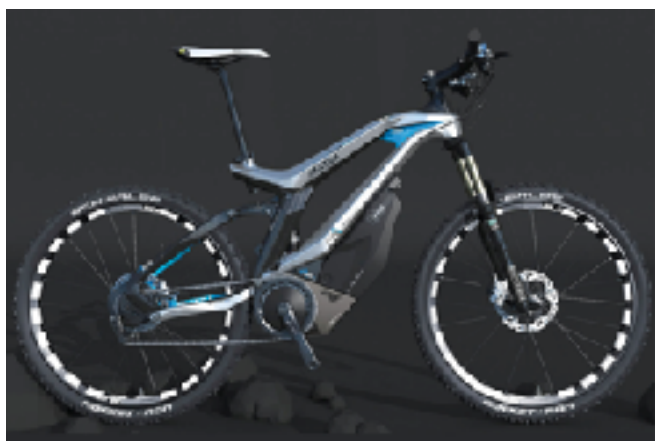
Velo électrique-75kmh matra-i-force-monster-xt10